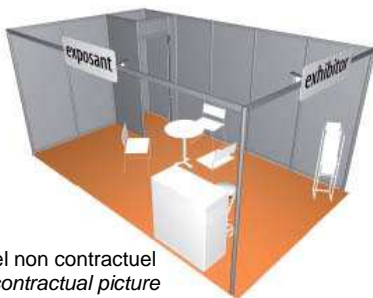
Visuel non contractuel Not contractual picture

Choisissez parmi les 3 harmonies possibles* / Choose from 3 different choices*: